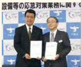
千歳市 平成27年2月4日

2月4日に100件目となる千歳市と災害時協力協定を締結しました。 平成22年9月に訓子府町と初めて災害時協力協定を締結してから5年目となります。弊協会は、これからも自然災害などの重大事故が発生した場合、または発生するおそれがある場合に、自治体の要請に応じ災害復旧活動の助力を行い、迅速な復旧に努めてまいります。