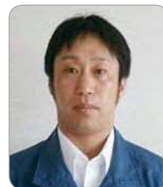
苫小牧支部 調査課 午末 直

点検終了後、「電気設備の不良箇所のお知らせ」をお渡しする場合は、現状の報告とともに、二次災害の危険性などを説明し、改修促進に努めています。