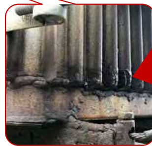
穴があいていた部分

お客さまに点検結果をお伝えし、至急交換していただくようお願いしました。その日のうちに工事をしていただき、高圧事故を未然に防ぐことができました。