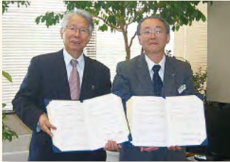
蘭越町 平成26年4月1日

弊協会は新たに次の自治体と「災害時協力協定」を締結いたしましたのでお知らせします。