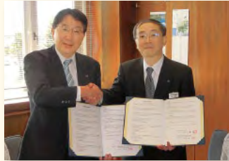
深川市 平成26年5月28日