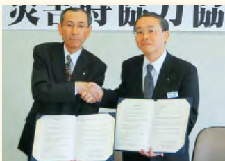
妹背牛町 平成26年5月28日