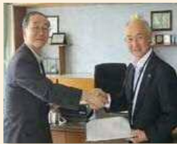
茅室町 平成27年7月24日

弊協会は新たに次の自治体と「災害時協力協定」を締結いたしましたのでお知らせします。