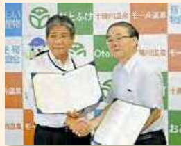
音更町 平成27年8月6日