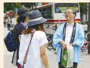
8/3 札幌東急百貨店前

キャンペーンでは、電気安全メッセージ入りのうちわやパンフレットなどを配布しました。合わせてアンケートにより電気の安全な使い方についてご説明させていただき、節電も含めご家庭でお困りの方にアドバイスさせていただきました。