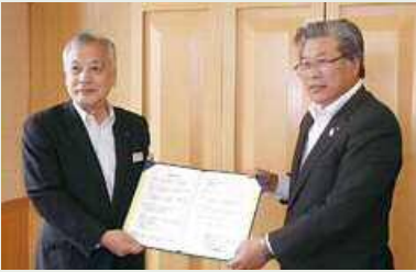
浜頓別町 平成29年7月20日