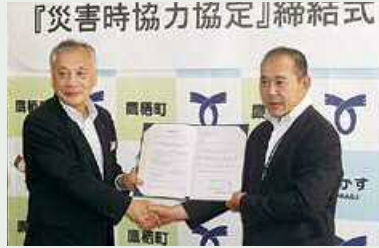
鷹栖町 平成29年7月13日