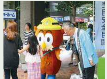
さっぽろ東急百貨店さま前

また、今年からは「ホーちゃん」の着ぐるみが出勤し、電気安全メッセージ入りのうちわなどを配布したほか、アンケートによる電気の安全な使い方や家庭での節電についてご説明いたしました。