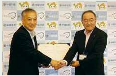
中頓別町 平成29年7月20日