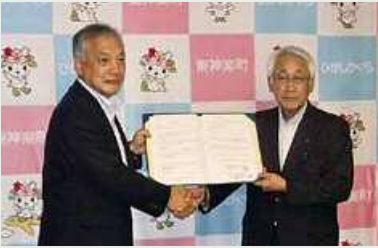
東神楽町 平成29年7月13日

弊協会は新たに次の自治体と「災害時協力協定」を締結いたしましたのでお知らせします。