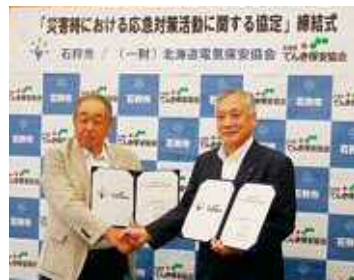
石狩市 平成30年8月9日