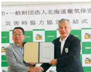
恵庭市 平成30年8月7日

弊協会は新たに2つの自治体と「災害時協力協定」を締結いたしました。 なお、平成30年8月9日現在で災害時協力協定締結した自治体は116の市町村です。